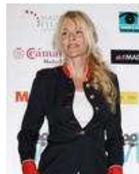
El cine español tiene más éxito fuera de nuestras fronteras