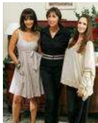
Paz Vega es Lola en 'La venganza de Don Mendo Rock'