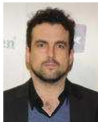
El extraterrestre de Vigalondo