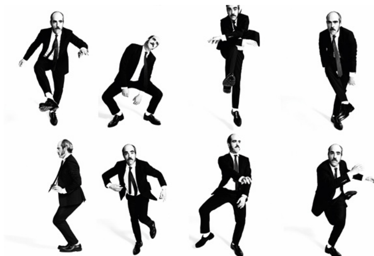
© Sergi Pons Por Fruela Zubizarreta