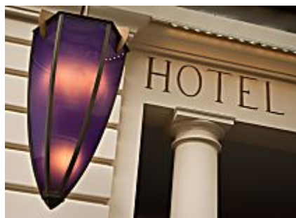
Los hoteles de lujo más baratos de España (trivago)