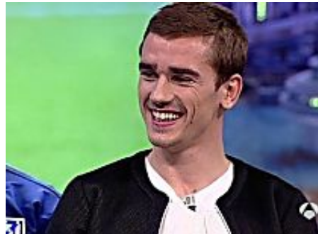
Griezmann en «El Hormiguero»: «Simeone odia a los gordos»