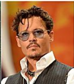
Johnny Depp, el «cameo» más famoso de «The Walking Dead»