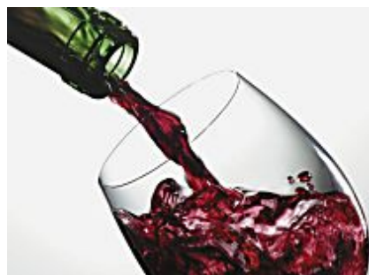
Brindis bueno, bonito y barato (Guía Repsol)