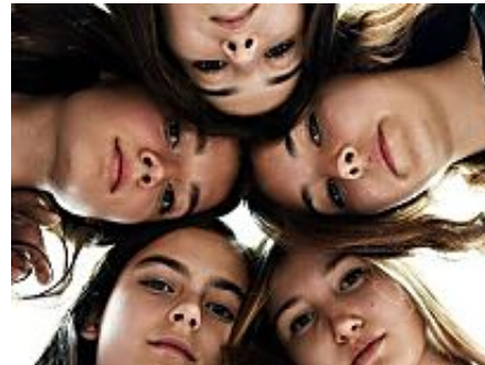
Crítica de «Mustang» (***) : Salirse del burka