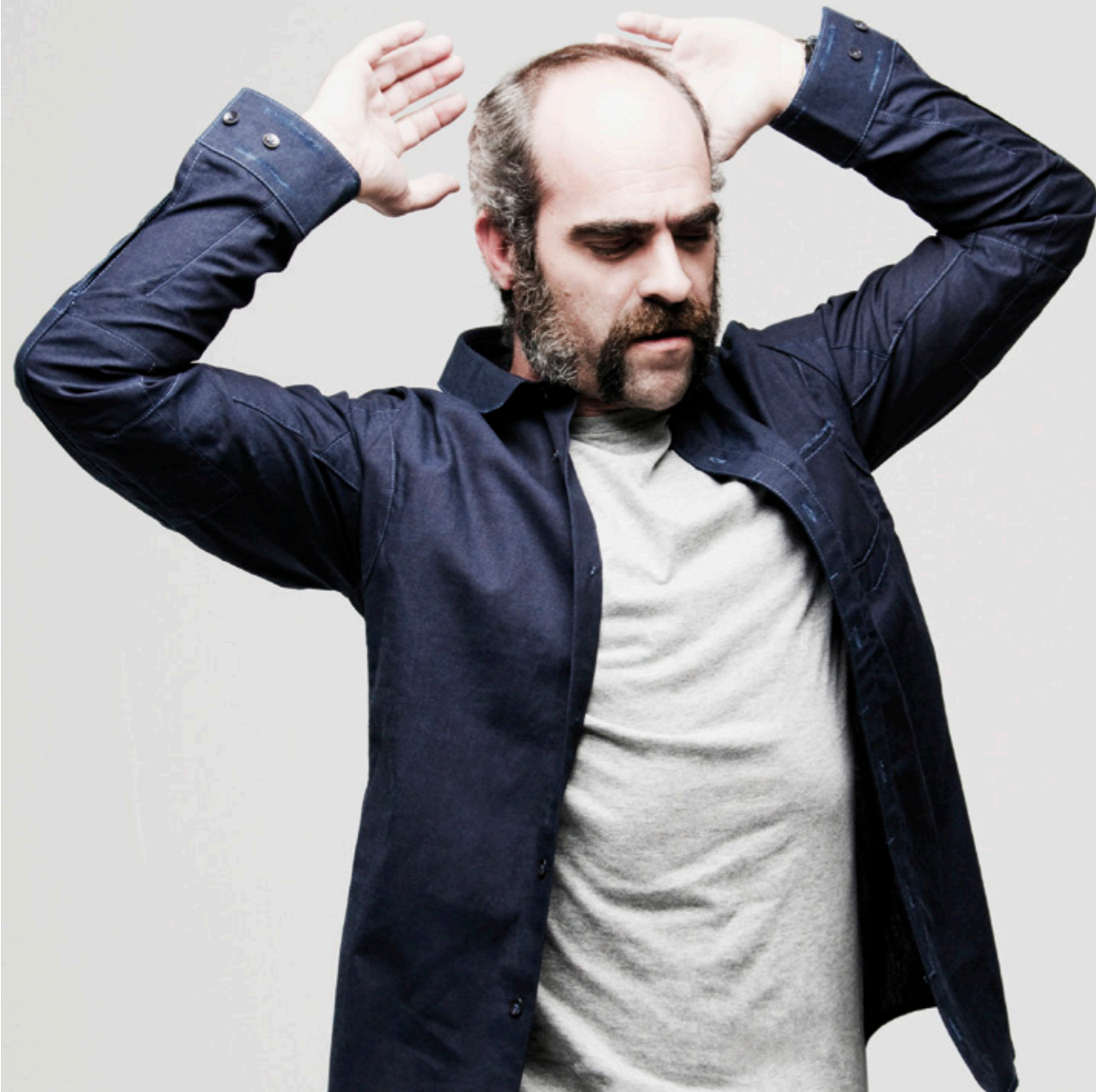
Camiseta SPRINGFIELD &lt;spf.com&gt; + Camisa G-STAR &lt;www.g-star.com&gt;

SENCILLAMENTE HIPNÓTICO. EL ACTOR GALLEGO INTERPRETA A JOSÉ CRISANTO EN 'OPERACIÓN E', UN FRENÉTICO DRAMA EN EL QUE RETOMA EL CASO DE UN COLOMBIANO, PADRE DE 5 HIJOS, AL QUE LAS FARC DEJARON UN NIÑO MALHERIDO A SU CUIDADO. ACONTECIMIENTO QUE LE CONVIRTIÓ EN FUGITIVO, CABEZA DE TURCO DE UNA CONTIENDA ENTRE COLOMBIA Y VENEZUELA. SU PAPEL Y PERFECTO ACENTO RECIBEN EL APLAUSO DE LA CRÍTICA, MIENTRAS LUIS TOSAR SORTEA EL MAYOR RIESGO DE SU OFICIO: DEJAR DE SER UNO MISMO.